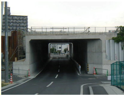
ボックスカルバート