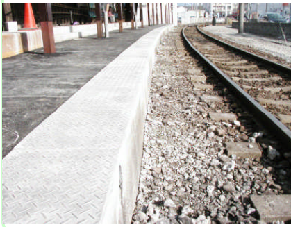
プラットホームパネル